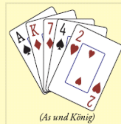
(As und König)