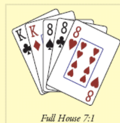
Full House 7:1