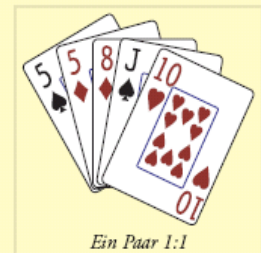
Ein Paar 1:1