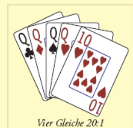
Vier Gleiche 20:1