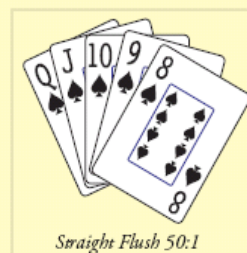
Straight Flush 50:1