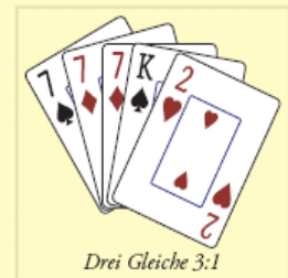
Drei Gleiche 3:1