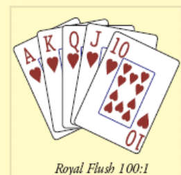
Royal Flush 100:1