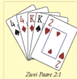
Zwei Paare 2:1